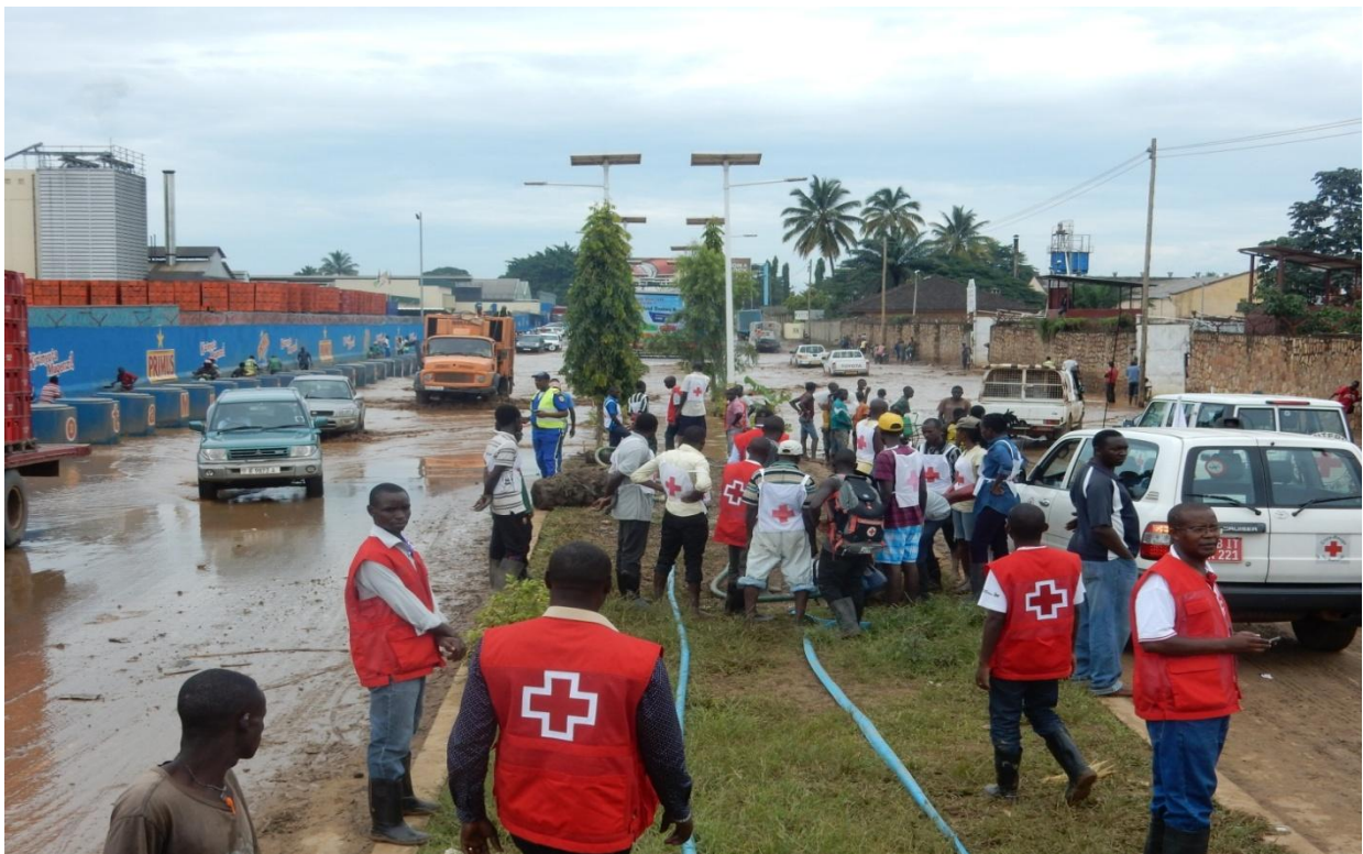
Evacuation des eaux d'inondation dans Bujumbura-Mairie

Parmi les activités de réponse réalisées, la Croix-Rouge du Burundi, conjointement avec le CICR, a effectué des travaux d'évacuation des eaux qui avaient inondé la Route Nationale N°5 au niveau de la compagnie de brasserie BRARURI dans la Branche Bujumbura-Mairie. Le CICR a donné un appui technique aux volontaires de la Croix-Rouge pour déboucher les caniveaux. Il faut également mentionner la pulvérisation des maisons et des latrines des ménages affectés par les inondations.