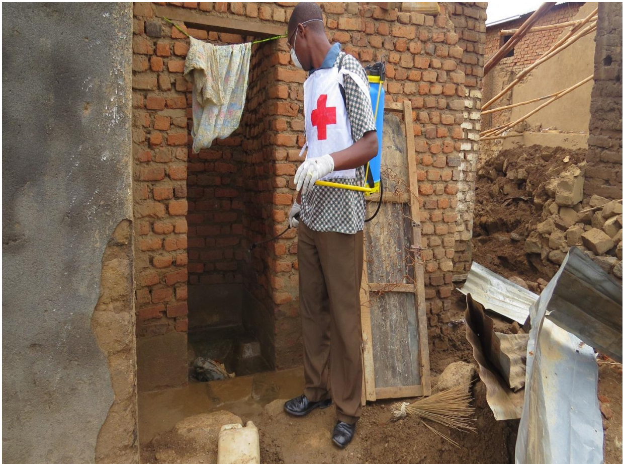
Pulvérisation des latrines

ROHERO 1, 18 Avenue des Etats-Unis - B.P. 324 Bujumbura-Burundi